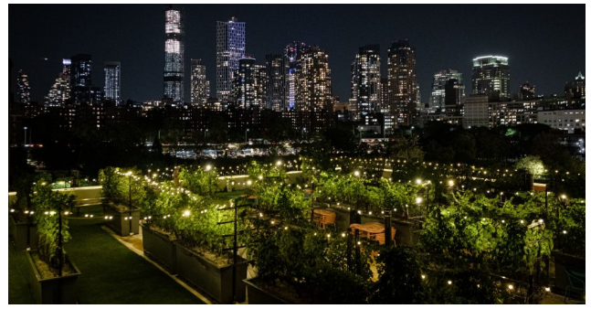
( https://www.eatpiemonte.com/wp-content/uploads/2022/02/New-York_Rooftop-Reds-c-1.jpeg )