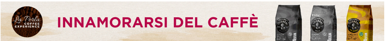
( https://www.laperladitorino.it/coffee-experience/ )