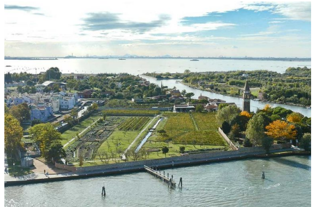
( https://www.eatpiemonte.com/wp-content/uploads/2022/02/Venezia_laguna-nel-bicchiere.jpg )