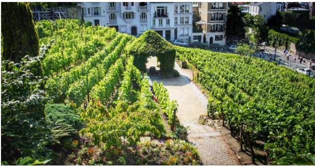
( https://www.eatpiemonte.com/wp-content/uploads/2022/02/Clos-Montmartre.jpg )